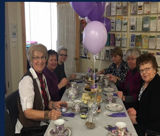
Mars 2017 - Journée internationale de la femme - Greenstone