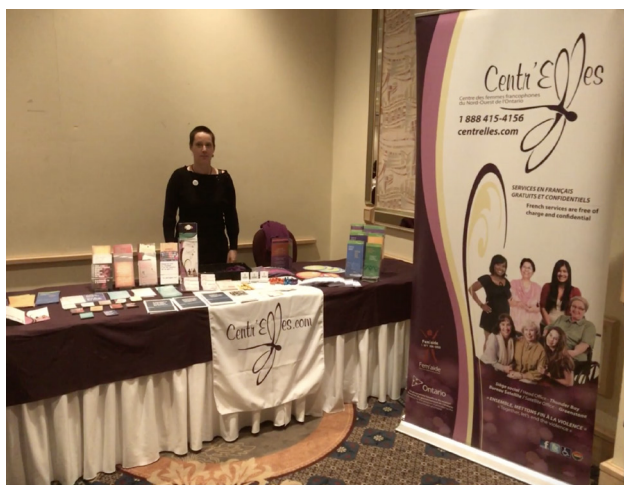
Kiosques lors d'une activité de sensibilisation avec Sheldon Kennedy (ex-joueur de la LNH)