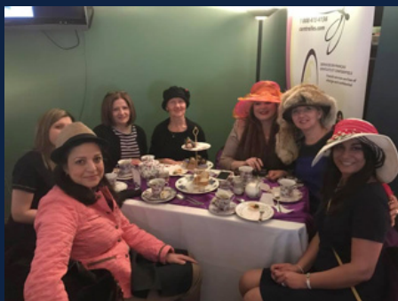
8 mars 2017 - Journée internationale de la femme -Thunder Bay