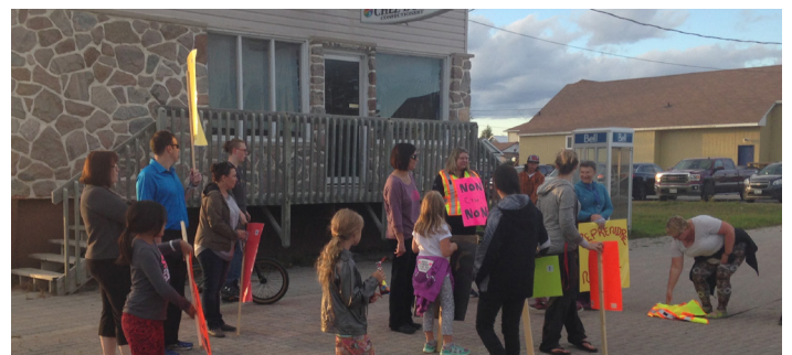
Septembre 2016 - Reprendre la nuit, Greentone