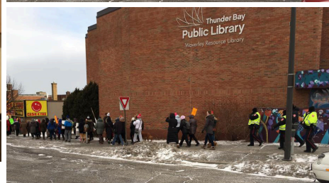
Mars 2017- Marche solidaire à Thunder Bay