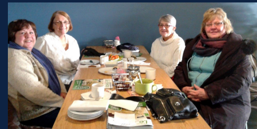
Café-Causette - Terrace Bay