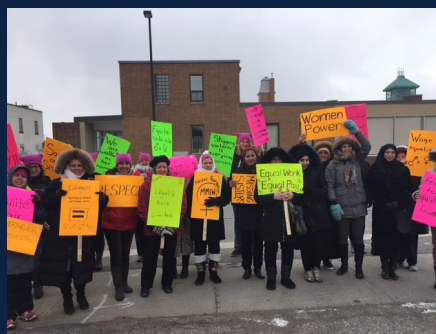
Mars 2017 - Grève pour protester l'inégalité des salaires entre les hommes et les femmes