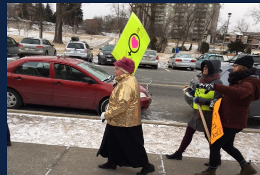
Mars 2017 - Marche solidaire organisée par Centr'Elles et d'autres organismes anglophones

Centr'Elles s'adapte et son personnel est proactif envers les environnements externes technologiques et médiatiques