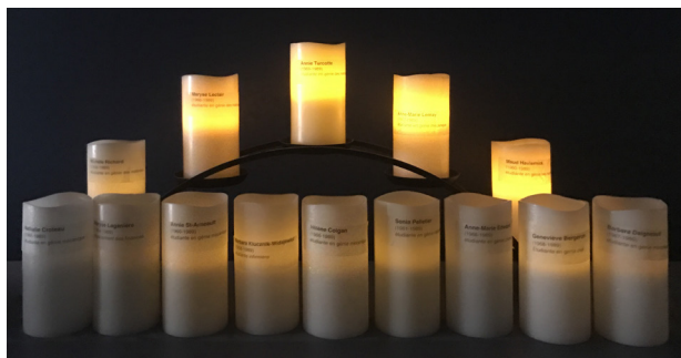
Commémoration du 6 décembre 2016 - Thunder Bay